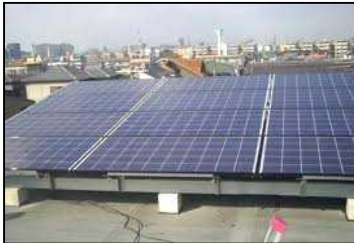
(太陽光モジュールの枚数が確認できる写真)