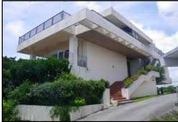
(設置する建物又は土地の全体写真)